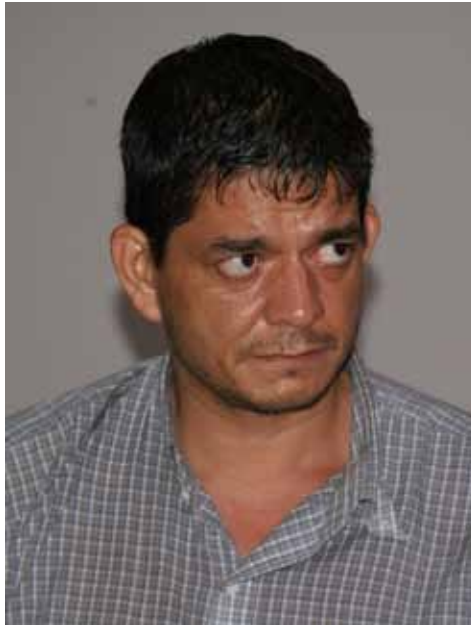
Chávez Abarca reconoce que desde septiembre del 2005 se planificó asesinar al Presidente de Venezuela.

Además, a lo largo de esa década hubo que enfrentar planes de atentado contra el Comandante en Jefe en casi todas las Cumbres Iberoamericanas que se efectuaron en distintas capitales y durante sus salidas al exterior, como lo demostró la captura in fraganti de Posada y sus secuaces en Panamá, donde con la intención de asesinarlo estaban dispuestos a provocar un genocidio en el que perderían la vida cientos de estudiantes universitarios y otros participantes en un acto que presidiría el compañero Fidel.