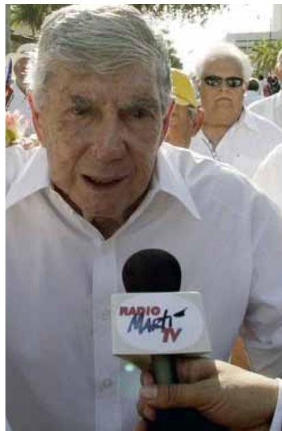
Terrorista Luis Posada Carriles se pasea por las calles de Miami.

La bomba detectada la víspera del Primero de Mayo de 1997 en el piso 15 del hotel Meliá Cohíba